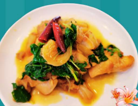
三杯鶏 (サンペイジー)