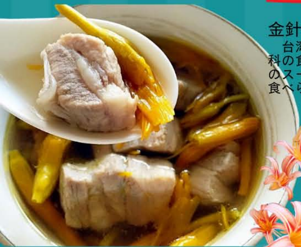
金針排骨湯 (金針花とスペアリブのスープ)

台湾東部で栽培されているユリ科の食用花。金針花とスペアリブのスープは台湾の一般家庭でよく食べられている料理です。